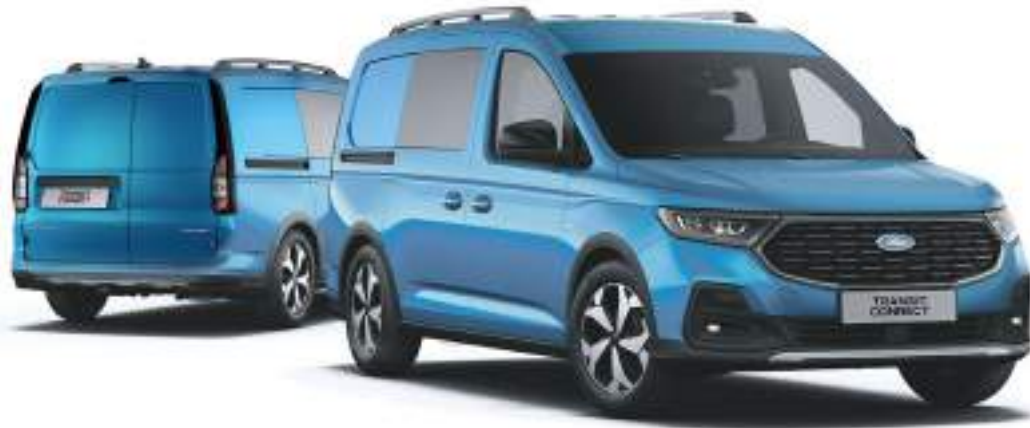
Nowy Ford Transit Connect Active FlexCab w wersji L2 z lakierem metalizowanym Boundless Blue (opcja)