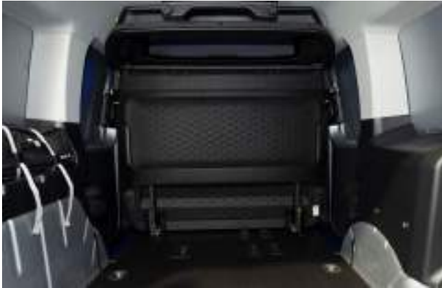
PRZEGRODA PEŁNA BEZ OKNA Wypożyczenie standardowe tylko wersji VAN