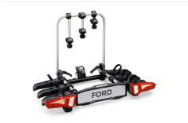
UCHWYT DO PRZEWOZU ROWERÓW - MOCOWANY NA HAKU HOLOWNICZYM Dostępny w wersji na 3 rowery 2 120 zł