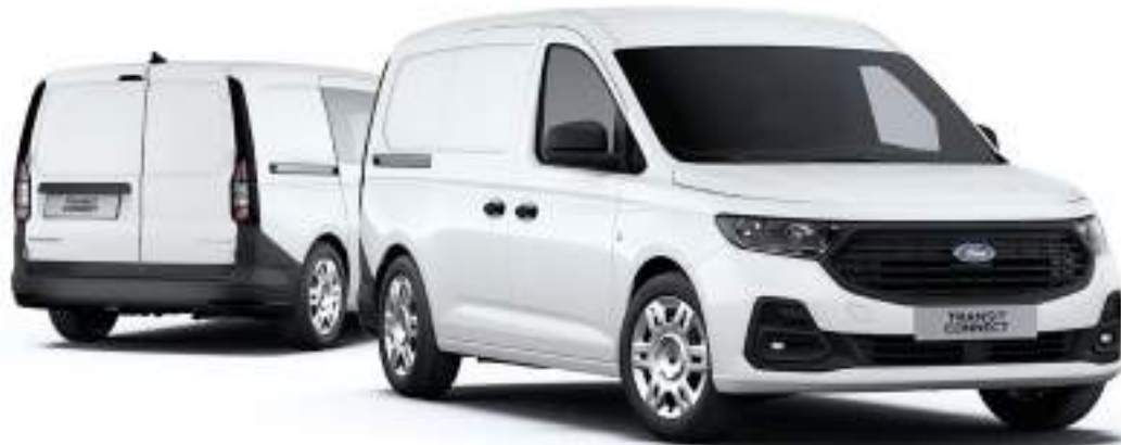
Nowy Ford Transit Connect VAN i FlexCab (po lewej stronie) w wersji L2 z lakierem zwykłym Frozen White (opcja)