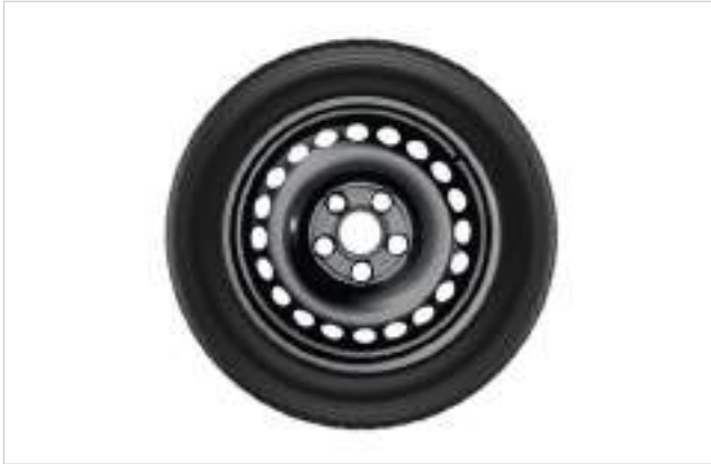
KOMPLET KÓŁ ZIMOWYCH, FELGI STALOWE 16" Z czujnikami ciśnienia, opony Dunlop WINTER SPORT 5, 205/60 R16 96H XL 3 408 zł