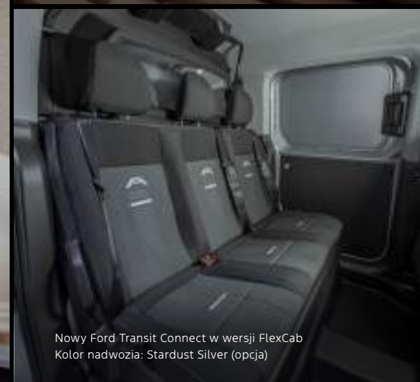
Nowy Ford Transit Connect w wersji FlexCab Kolor nadwozia: Stardust Silver (opcja)