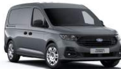
COMET GREY - LAKIER ZWYKŁY bez dopłaty