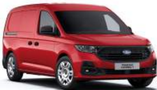
LAVA RED - LAKIER ZWYKŁY bez dopłaty