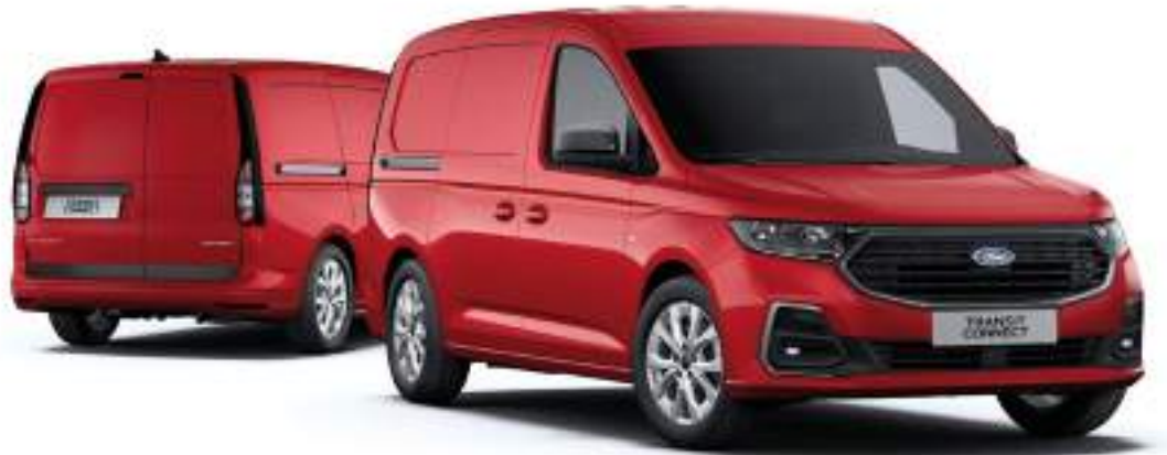
Nowy Ford Transit Connect VAN w wersji L2 z lakierem zwykłym Lava Red (bez dopłaty)