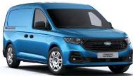
BOUNDLESS BLUE - LAKIER METALIZOWANY 2 000 zł