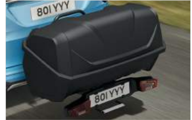
BAGAŻNIK MOCOWANY NA HAKU HOLOWNICZYM 2 374 zł