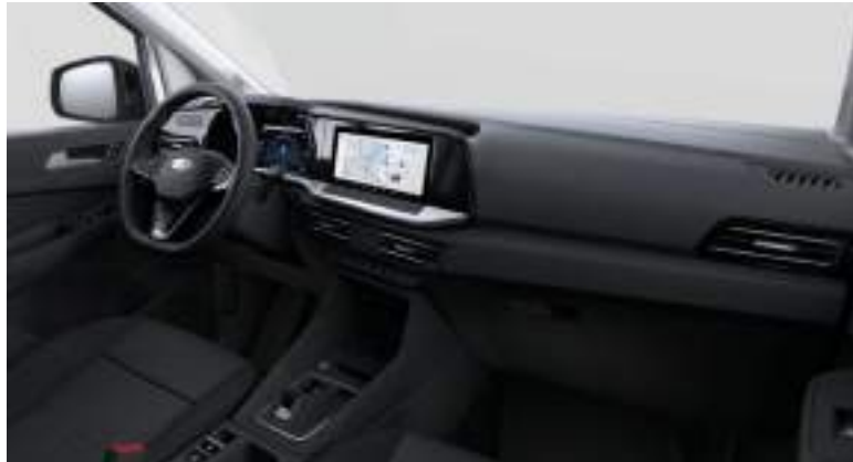
Nowy Ford Transit Connect ze skrzynią automatyczną i tapicerką materiałową (standard)