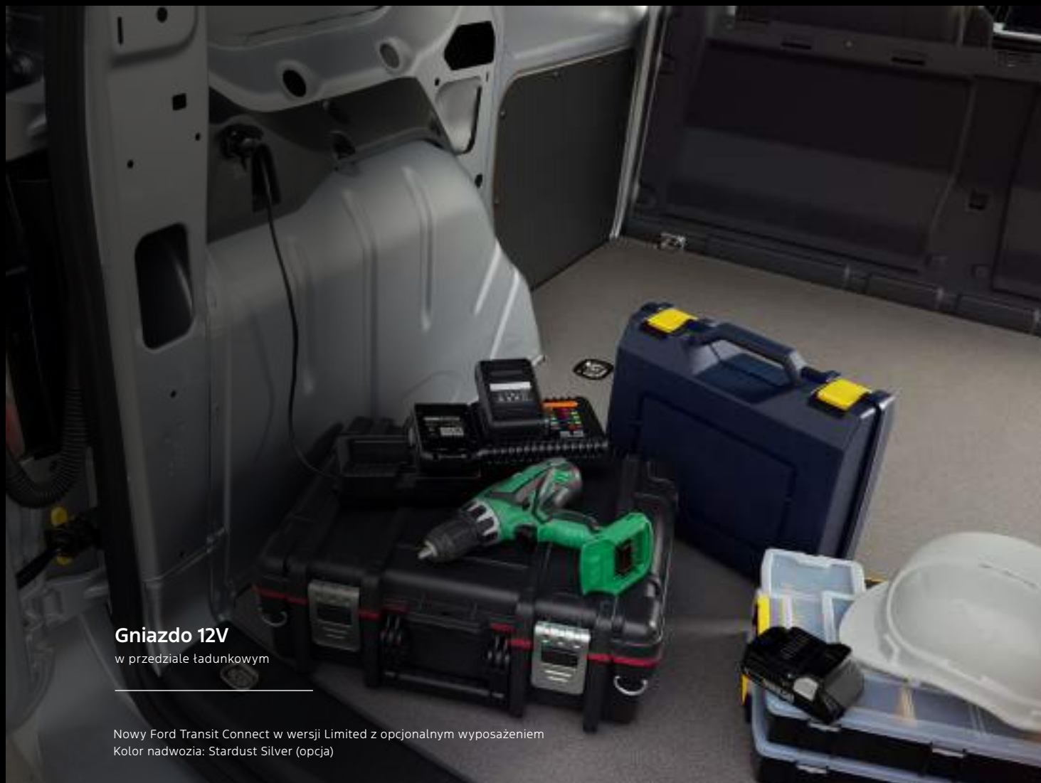
Gniazdo 12V w przedziale ładunkowym

Nowy Ford Transit Connect w wersji Limited z opcjonalnym wyposażeniem Kolor nadwozia: Stardust Silver (opcja)