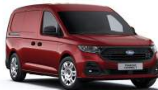
MAPLE RED - LAKIER SPECJALNY 2 000 zł