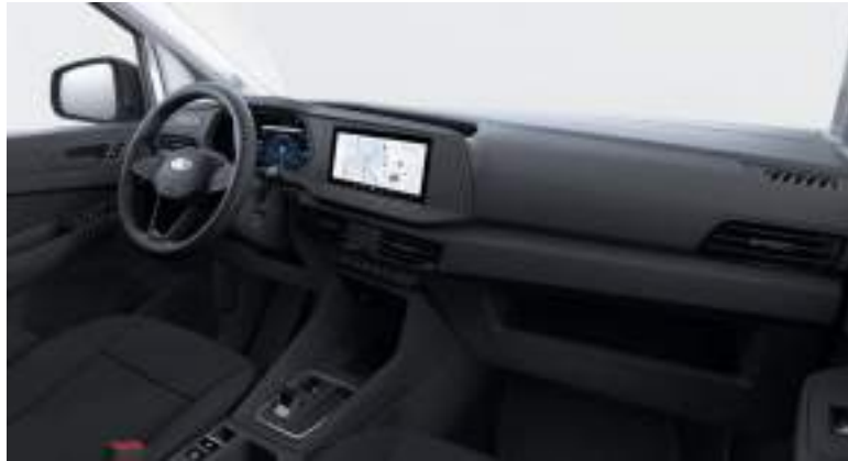
Nowy Ford Transit Connect ze skrzynią automatyczną i tapicerką materiałową (standard)