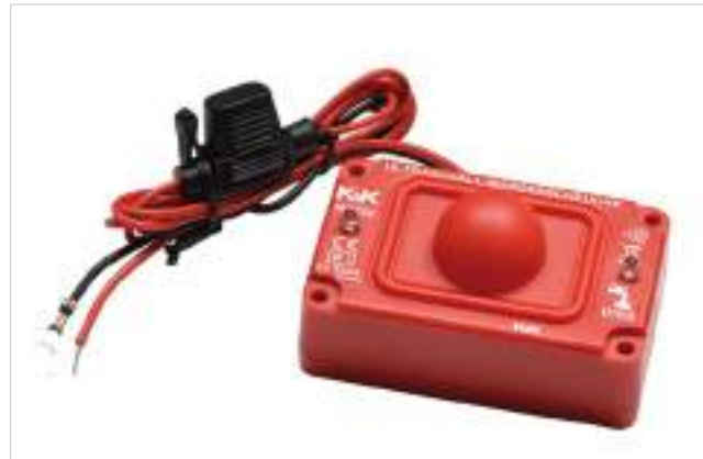
ODSTRASZACZ KUN M2700, Z OCHRONĄ ULTRADŹWIĘKAMI 383 zł