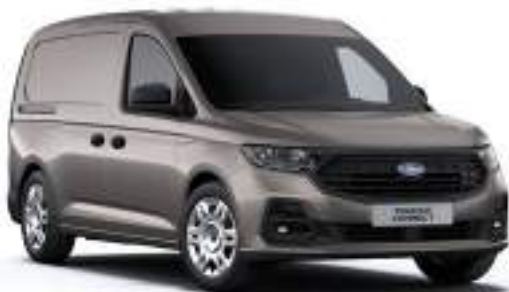
DUSKY SILVER - LAKIER METALIZOWANY 2 000 zł