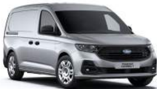
STARDUST SILVER - LAKIER METALIZOWANY 2 000 zł