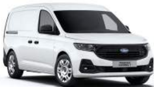
FROZEN WHITE - LAKIER ZWYKŁY bez dopłaty