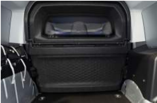
PRZEGRODA PEŁNA Z OKNEM Opcja tylko dla wersji VAN