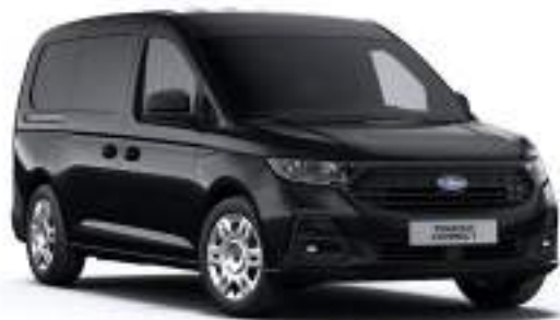
INK BLACK - LAKIER METALIZOWANY 2 000 zł