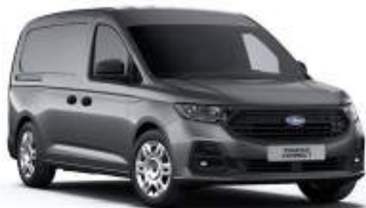
GRAPHITE GREY - LAKIER METALIZOWANY 2 000 zł