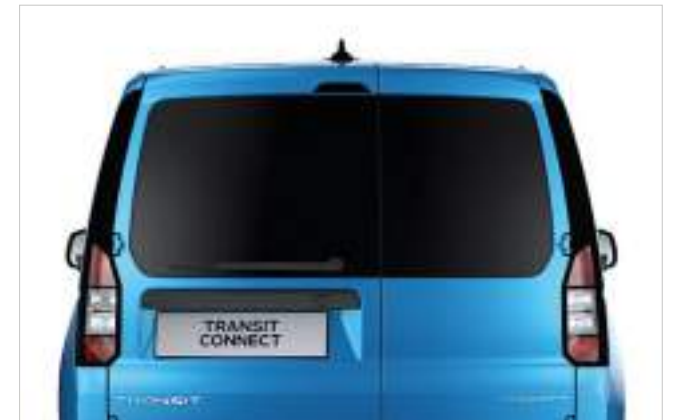
SZYBY W DRZWIACH TYLNYCH Z WYCIERACZKĄ I SPRESKIWACZEM Opcja tylko dla wersji FlexCab