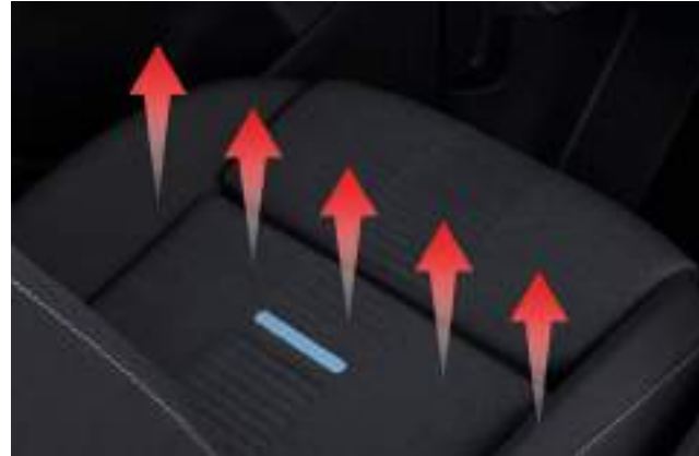
PODGRZEWANIE FOTELI PRZEDNICH - ZESTAW DO DWÓCH FOTELI UWAGA: montaż musi zostać przeprowadzony wyłącznie przez Autoryzowany Serwis. 1 150 zł