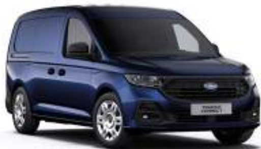
MIDNIGHT BLUE - LAKIER METALIZOWANY 2 000 zł